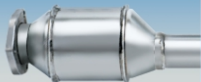
DIESEL Oxi-Kat Oberland Ab Bj.'85